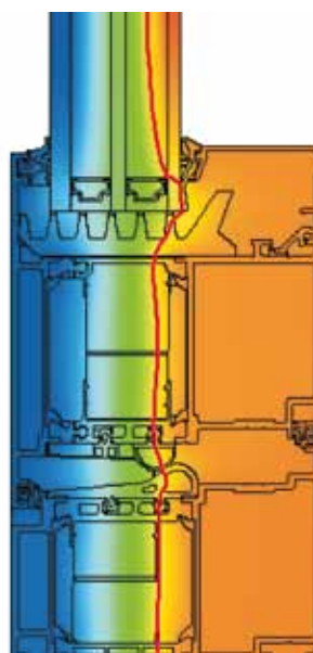
Isothermenverloop Schüco deur ADS 90 SI Courbes isothermes porte Schüco ADS 90 SI